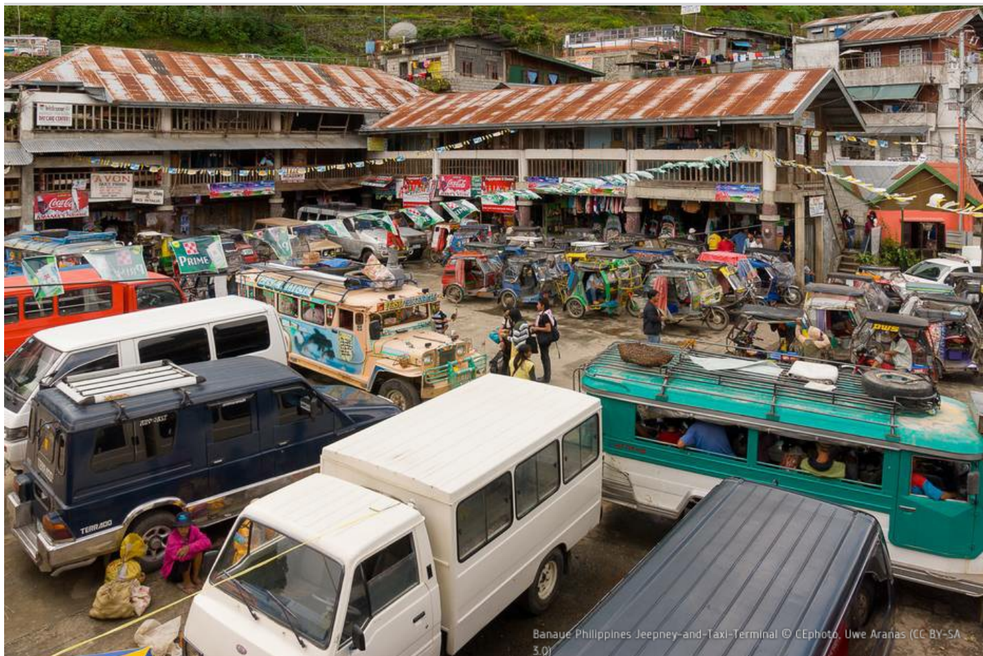
Banue Philippines Jeepney-and-Taxi-Terminal

Währung: Philippinischer Peso (PHP) Wechselkurs: 59,06 Peso pro € (Dezember 2020) Zeitzone: UTC/GMT + 8 Std. Landesvorwahl (Telefon): +63 Klima (für Hauptstadt): Tropisch